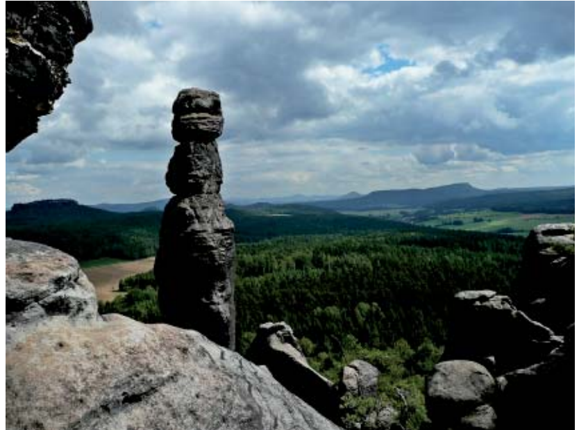
Barbarine am Pfaffenstein

Halbpension 42 Euro pro Tag und Person, Doppelbettzimmer.