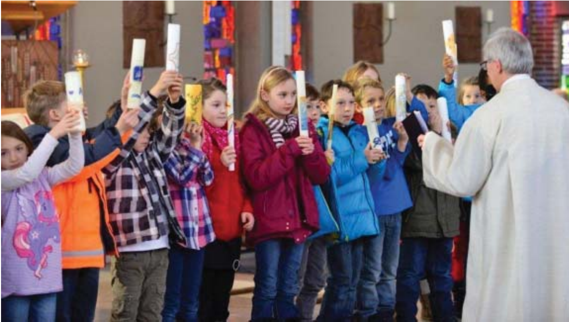
Das sind unsere Taufkerzen!