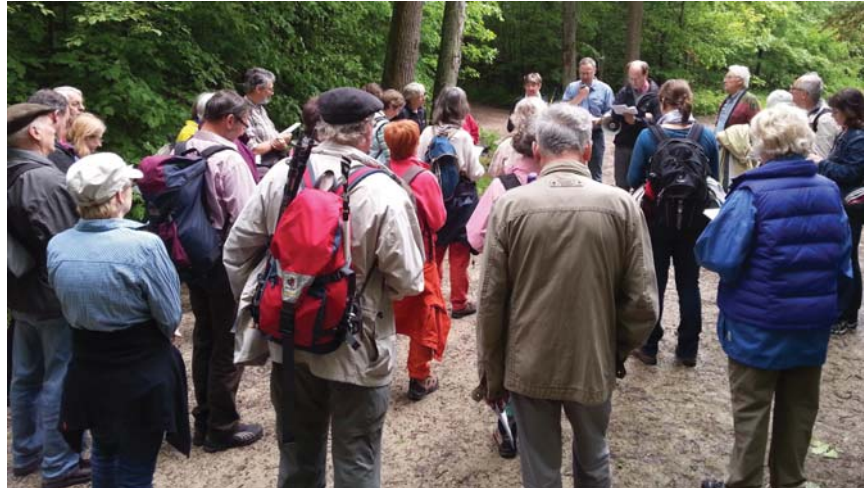
Im Forchheimer Kellerwald

Radler und Wanderer aus den evangelischen und katholischen Gemeinden im Erlanger Süden begaben sich auf den "Weg des Menschen" nach Martin Buber. Vier Stationen auf dem Weg nach Weilersbach in die Kirche St. Anna hörten wir vom Geist, der zur Umkehr einlädt, vom Geist, der uns beruft, vom Geist, der die Seele eint und vom Geist, der inneren Frieden schenkt.