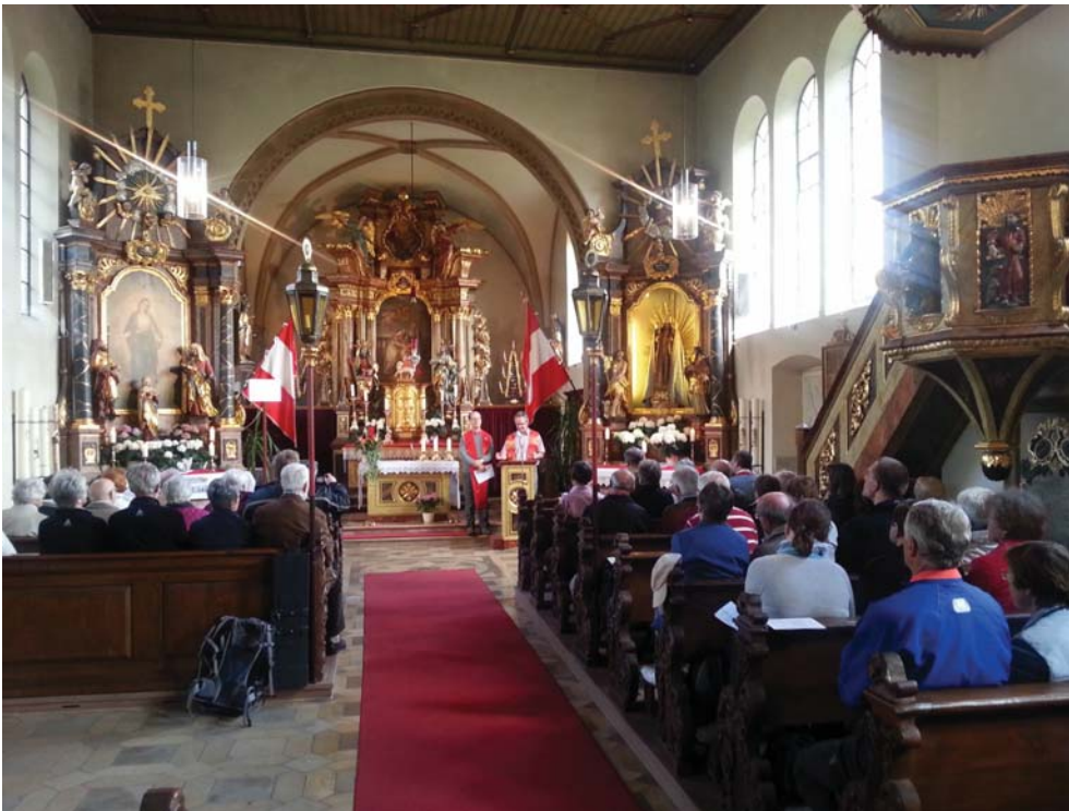
Die Wallfahrtskirche St. Anna in Weilersbach, älterer Teil

In den letzten beiden Stationen stellten wir uns zusammen mit den Autowanderern dem Geist, der uns in die Welt sendet und dem Geist, der sich im Hier und Jetzt, im Leben und im Alltag zeigt.