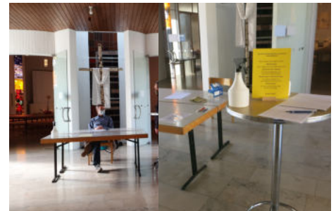
Helfer sind bereit