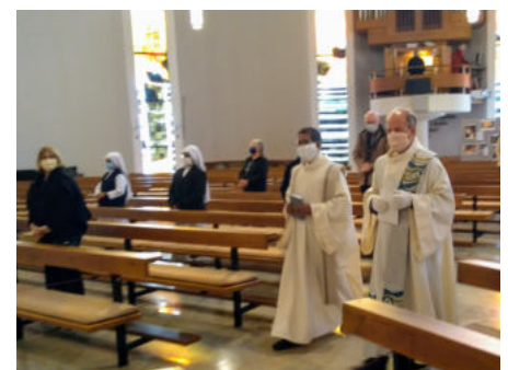
Abstandsgebot und Mundschutz sind wichtig

tionen entnehmen Sie bitte Wochenblatt, Schaukasten oder unserer Webseite.