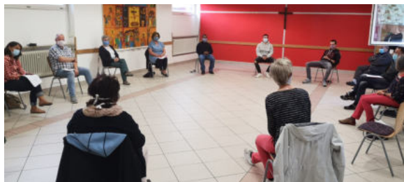
Pfarrgemeinderatssitzung unter Corona-Bedingungen

Seit Anfang Mai ist es wieder möglich, unter Beachtung der nötigen Schutzvorkehrungen (z.B. Abstand in den Sitzreihen, Mund-Nase-Schutz, Registrierung der Teilnehmer) Gottesdienste in Heilig Kreuz zu feiern. Auch Gremiensitzungen sind mit entsprechenden Einschränkungen wieder möglich und so traf sich der Pfarrgemeinderat am 27. Mai zu einer Sitzung, die ausnahmsweise im Pfarrsaal abgehalten wurde, um den nötigen Abstand zwischen den Beteiligten zu ermöglichen.