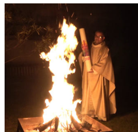
Osterfeuer ausnahmsweise im Innenhof