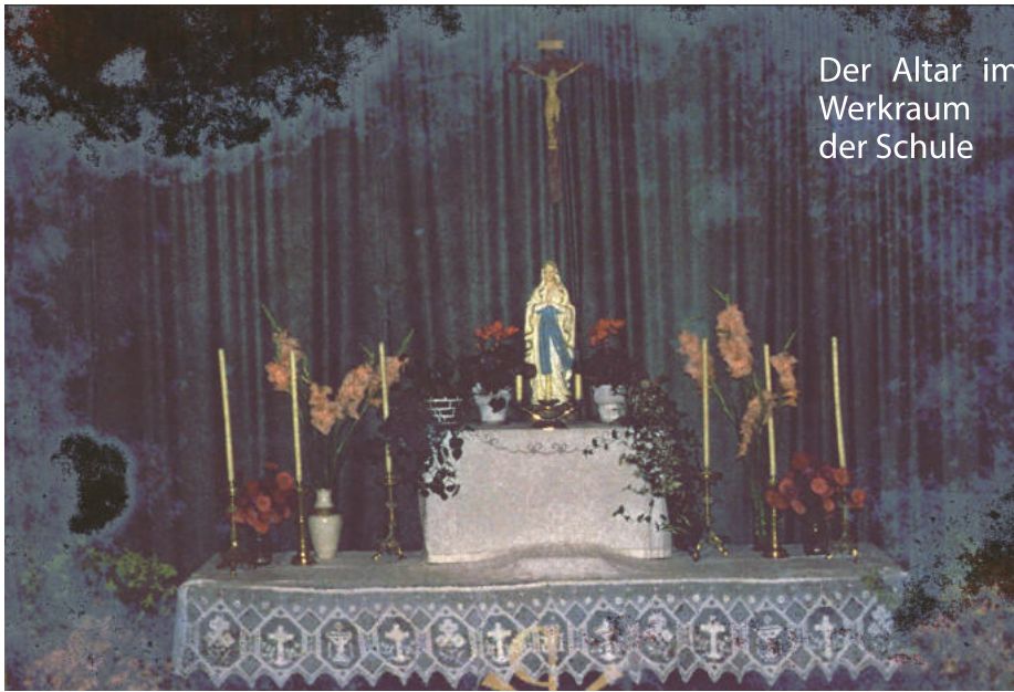
Der Altar im Werkraum der Schule