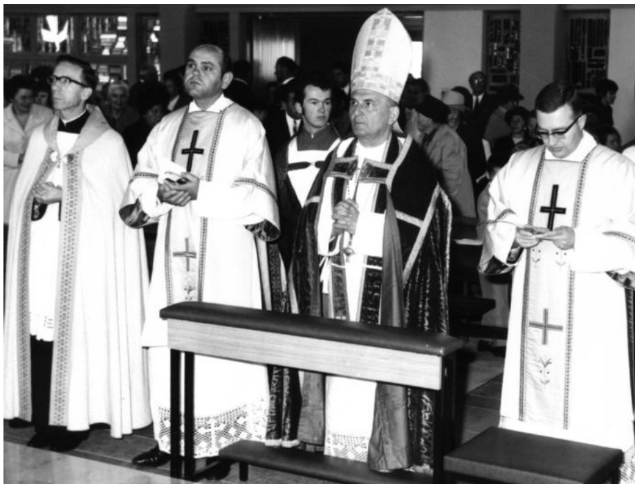
Weihe der Kirche: 18. Juli 1970 durch Weihbischof Martin Wiesend, am gleichen Tag werden auch noch eine Hochzeit und die Firmung gefeiert.