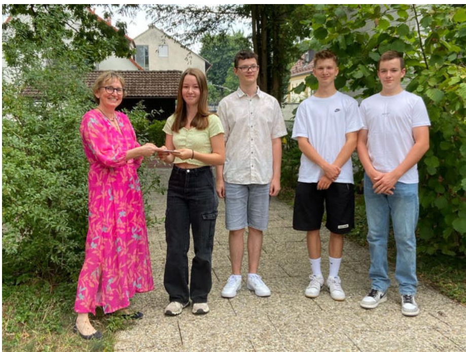
Vier Firmlinge überreichen die Spende an die Rektorin der Grundschule.