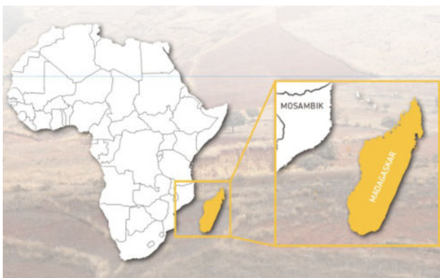
Madagaskar liegt im Südosten Afrikas.

Wir hoffen, Sie haben nicht vergeblich auf uns gewartet und bitten nachträglich um Ihr Ver-